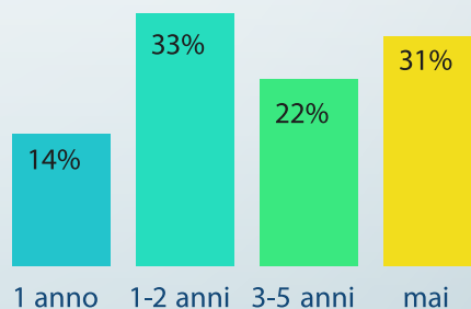
ENTRO QUANTO TEMPO LE AZIENDE B2B ONLINE PENSANO DI DIGITALIZZARE IL CATALOGO statistiche effettuate su 225 B2B online

Ideale per tutte le tipologie di aziende che hanno voglia di supportare il proprio business con strumenti di automazione e velocizzazione dei processi